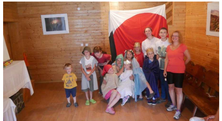
Záverečné divadielko.