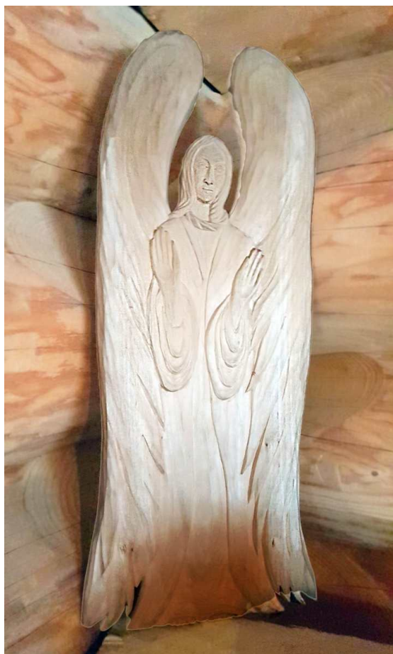
Vyrezávaný drevený anjel – dar od poľských účastníkov konferencie.

V dňoch 17. - 19. februára 2017 sa uskutočnila vo Vrútkach medzinárodná konferencia Spoločenstva kresťanov. Hlavnou témou stretnutia bolo *Postkonfesionálne kresťanstvo .