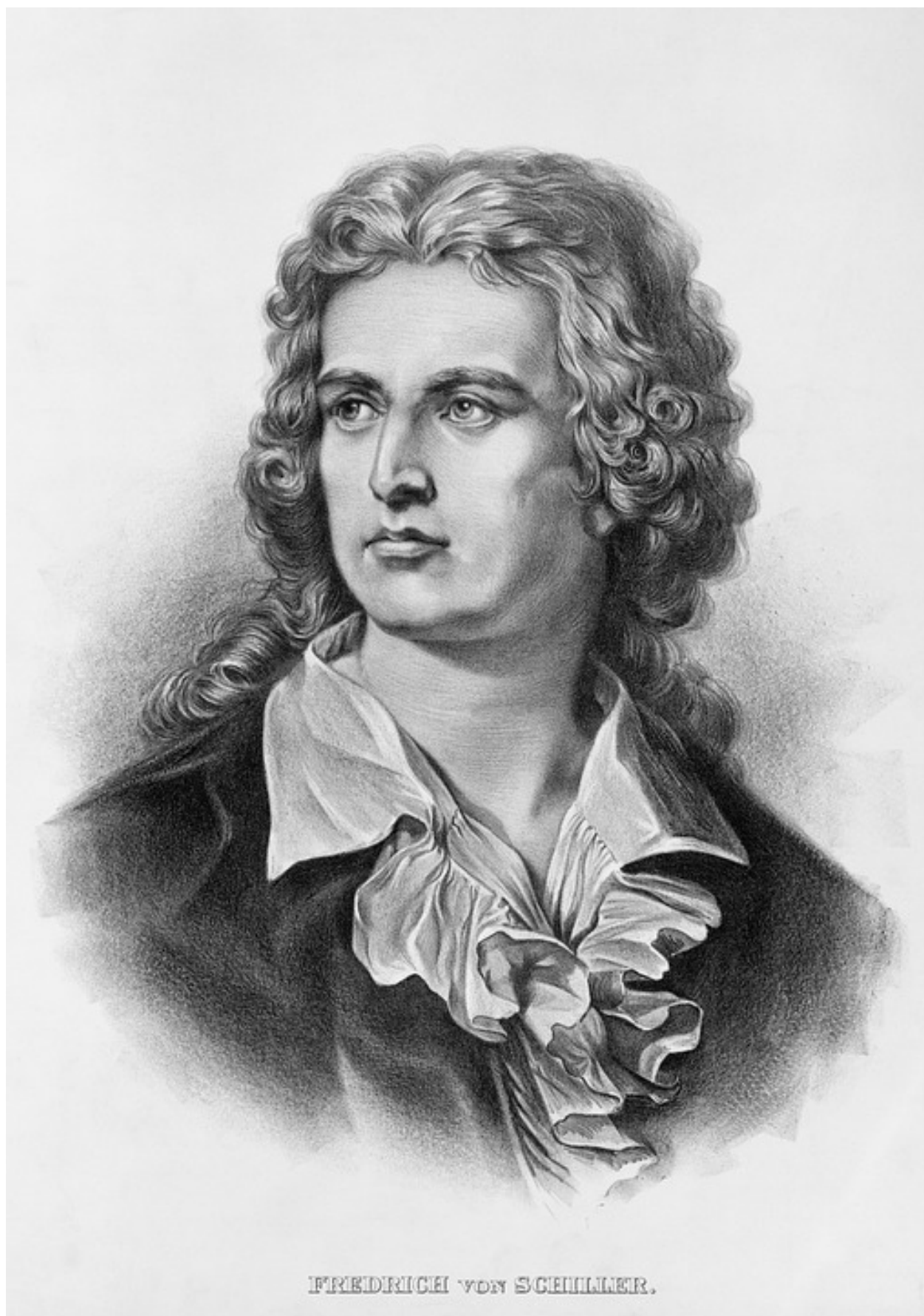
FRIEDRICH VON SCHILLER.